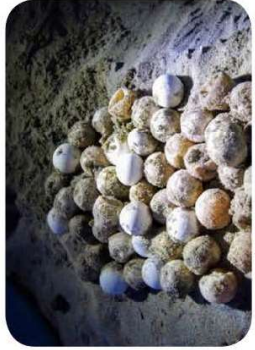
œufs de tortues découverts sur une plage de Palma orientale.

Cet été, il s'est passé quelque chose de très inhabituel sur une plage de la côte orientale de Corse, près de Ghisonaccia : on a trouvé 23 bébés tortues qui étaient nés dans le sable et 56 œufs qui ont éclos dans les jours suivants (photos ci-dessus). Il s'agissait de petites tortues caouannes, une espèce de tortue marine qui vit en Méditerranée. Ces tortues sont de grandes voyageuses : elles vont et viennent entre leurs lieux de ponte, plutôt dans l'Est de la Méditerranée, en Grèce, en Turquie ou en Israël, et l'Océan Atlantique, où elles vivent une fois adultes.